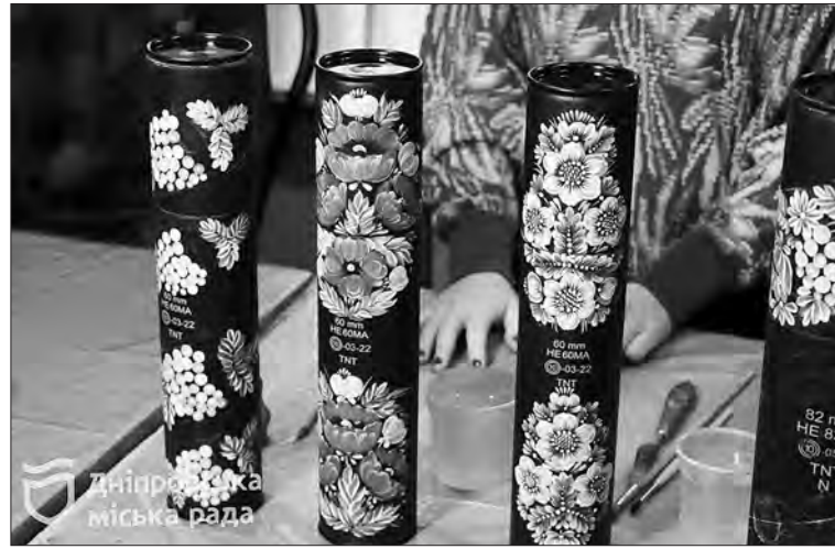
Дніпровська міська рада

«Розмальовуємо такі тубуси і залишаємо маркування від снарядів як нагадування, що країна бореться за свою свободу, незалежність, світле й вільне майбутнє. Саме ці квіти і