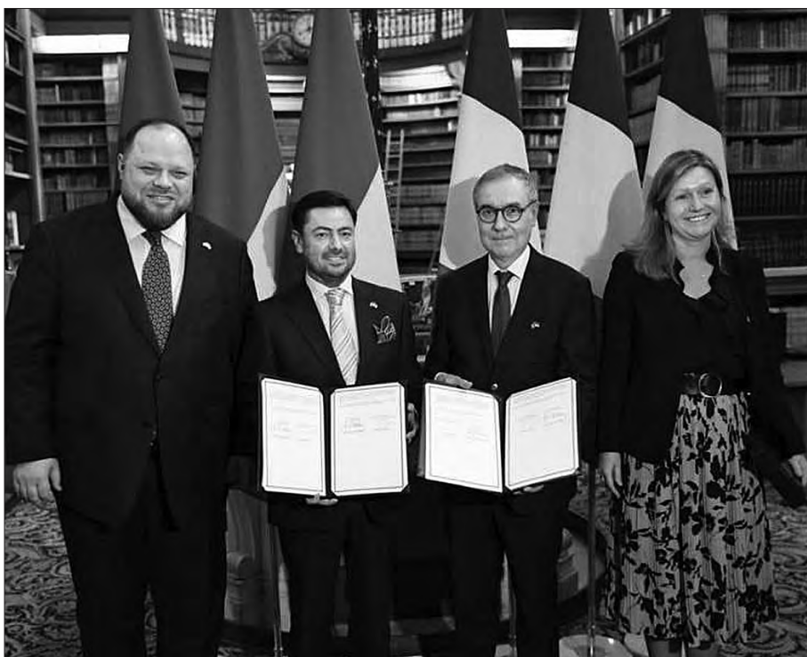
ського Союзу, Протокол передбачає передачу

Крім того, з метою сприяння процесу вступу України до Європей-