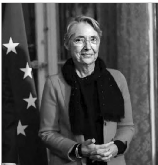
Президента України Володимира Зеленського, а також

Водночас він зауважив, що для України значимими є питання відбудови, дотримання формули миру