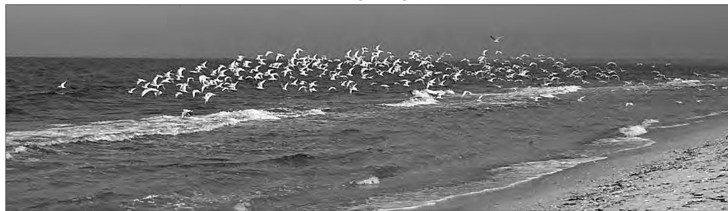
Кінбурн називають пташиним царством.